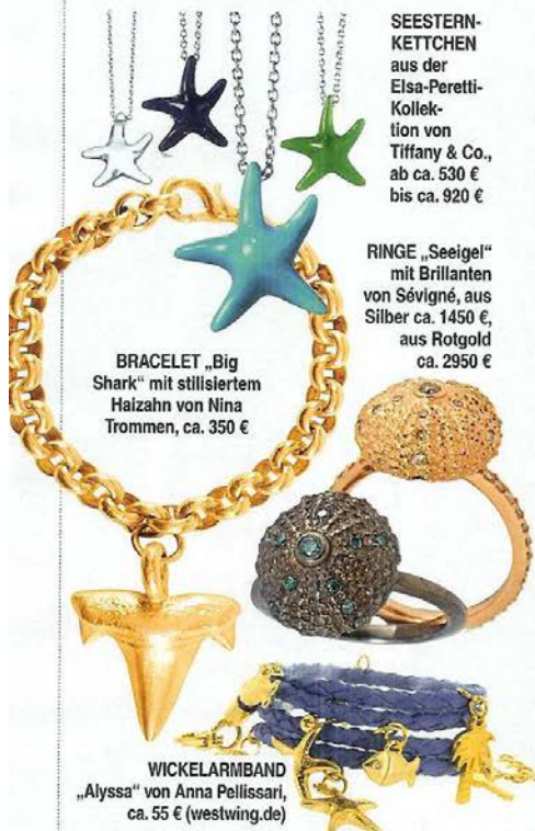
BRACELET „Big Shark“ mit stilliertem Haizahn von Nina Trommen, ca. 350 €